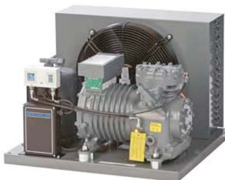
Полугерметичный компрессорно-конденсаторный агрегат DK/DL

Данная серия компрессорно-конденсаторных агрегатов оборудована одним или двумя вентиляторами, что обеспечивает значительную компактность. Обширный модельный ряд позволяет выбрать устройство для большинства сфер применения, в том числе для эксплуатации в экстремальных условиях, например, при высоких температурах кипения и высоких температурах окружающей среды.